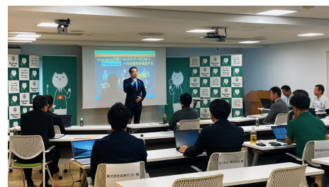
▲ 出展候補企業を選考するピッチイベントの様子

りそな銀行の企画ではグループ銀行の4社が一丸となって企業を支援する。展示の順番も26週の内の1週目を担うことから、準備にも気合が入っているとのことだ。約1年後に迫った2025年大阪・関西万博で、中小企業・スタートアップが活躍する姿が期待される。